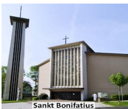
Ihringshäuser Str. 3

Ukrainehilfe der Malteser Kassel : Marburger Str. 87, Tel: 0561 - 8619142