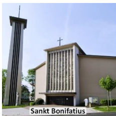
Sankt Bonifatius Ihringshäuser Str. 3

Sozialbüro Sankt Joseph : Marburger Straße 87, 34127 Kassel (Gemeindehaus), Tel: 0561 - 8 61 76 89; Fax: 0561 - 8 56 90, geöffnet Donnerstag, 10.30 bis 13 Uhr