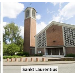
Sankt Laurentius Weidestr. 36