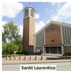
Sankt Laurentius Weidestr. 36