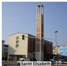
Sankt Elisabeth Friedrichsplatz 13